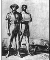
Barcsay Jenő: Két munkás talicskával, 1950

alkotójuk az öncélú absztrakcióban tetszeleg, ami járhatatlan út a szocialista művészet számára, és a nézők közül is sokakban kelt ellenérzést. Ez az első olyan kiállítás, ahol európai és ázsiai művészek költszen szerepelnek. A kínaiak és a koreaiak kedvelik a tus használatát, a vietnamiak a lakkfestészetet, de esztétikai bizonytalanság lesz úrrá rajtuk, ha az európai stílusok nyelvén szólnak meg – fejlődésük azonban gyors. A szocialista realizmussal szemben a legfőbb rágalom, hogy uniformizál, ezt azonban a tárlat meggyőzően cáfolja: a 12 nép alkotóinak munkáiban szembetűnőek a nemzeti jellegzetességek. A részt vevő országok egybehangzó óhaja, hogy a seregszemle két- vagy háromévenként megismétlődjön. (Moszkva, Maryézs, megtekinthető volt 1959. március 3-ig. )